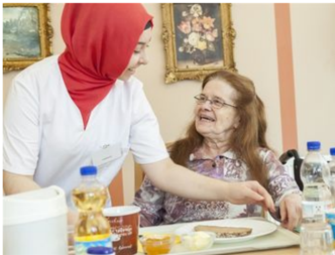
von Altenpflegehelfer/in ...